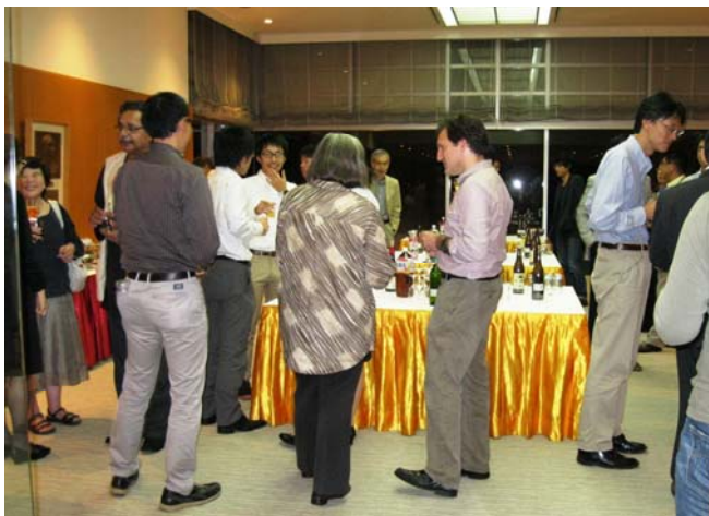
和やかなレセプション

18:30-21:00 Reception (@Haruka (Japanese Restaurant in Kunitachi))