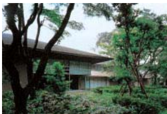
会場となった一橋大学・佐野書院

いずれのセッションでも、白熱した議論が展開され、議長がセッションを閉めるのに一苦労する一幕もありました。コーヒープレイクやレセプションの場でも参加者間の活発な交流が行われ、密度の濃い充実したワークショップとなりました。今回のワークショップが今後の研究の進展につながり、次回もまた盛り多いワークショップが開催できることを期待しています。なお、本ワークショップの報告論文および改訂版の一部は、順次、PRIMCED プロジェクトのディスカッション・ペーパーとして公開される予定です。