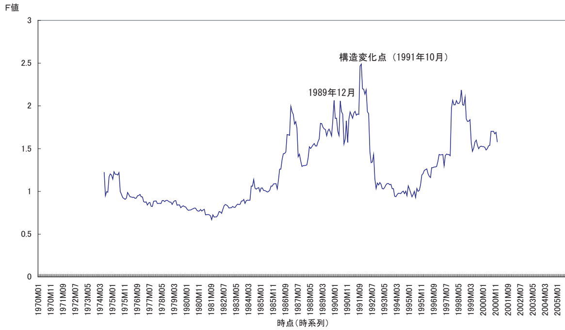
図 3: 超過収益率の構造変化 (ラグ 4)

VAR の体系に含まれる超過収益率の予測方程式を用いて、各時点での Chow 検定で計算される F 統計量をグラフ化したものである。構造変化のある可能性のある時点としてサンプルの両端 15% を除いたすべての時点で計算している。